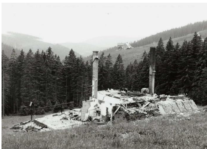
Jak jsem ji viděl 25. června 1984