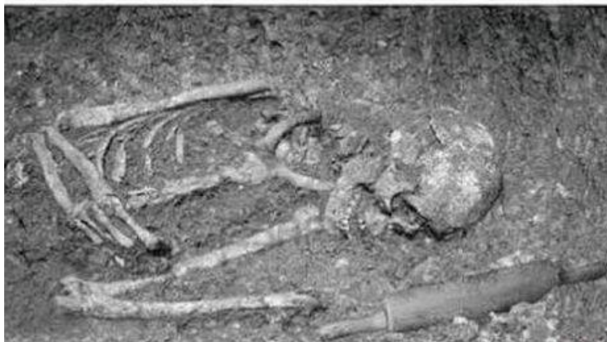
Historici našli u Otína německou stíhačku z 2. světové války

„Já jsem šel na to jinak. Nařídil jsem budík na půl šestou ráno, a když dozvonil, zašeptal jsem manželce do ucha: Na ryby, nebo se pomilujeme? No a ona jen zasyčela: Vezmi si teplý prádlo!“