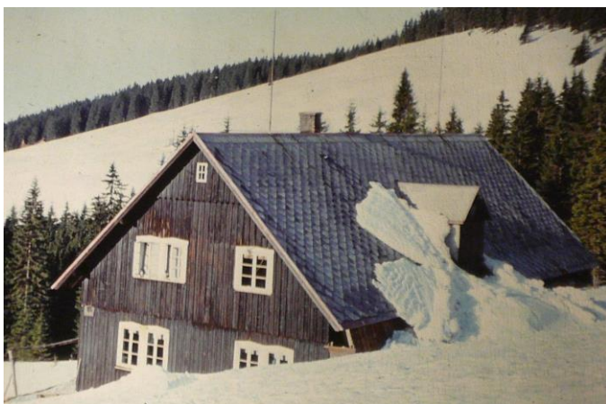
Před nocí z 23. na 24. června 1984